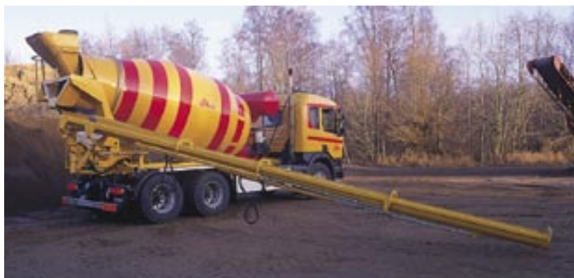
9 meters utskjut med 90° vinkel.

MSM 9 kan monteras på de flesta rotorbilar.