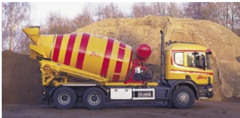
Rännan i transportläge.