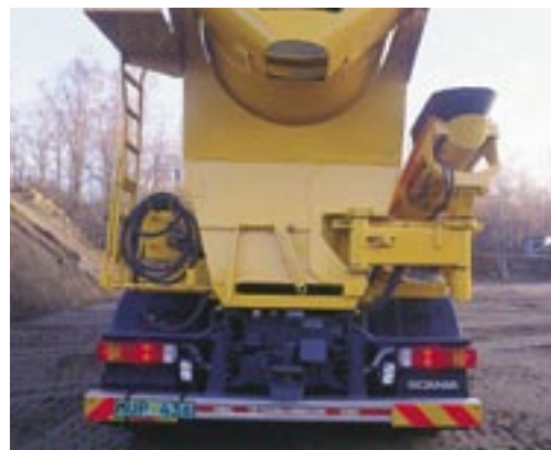
Låsarm och infästning av rännan.

Större lönsamhet, bättre arbetsmiljö, smidigare leveranser – Allt fler har upptäckt fördelarna med MSM 9-rännan. Rännans flexibilitet med steglös variabel längd upp till 9 meter och en svängradie upp till 180° är en oslagbar lösning för utläggning av betong. Med MSM 9 kan ni leverera betong på de mest svåråtkomliga gjutplatser.