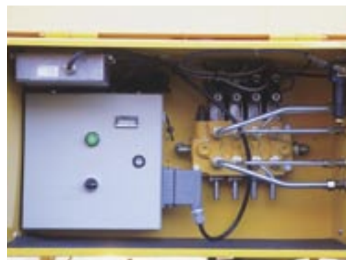
Styrskåpet med mottagare till radiostyrning.