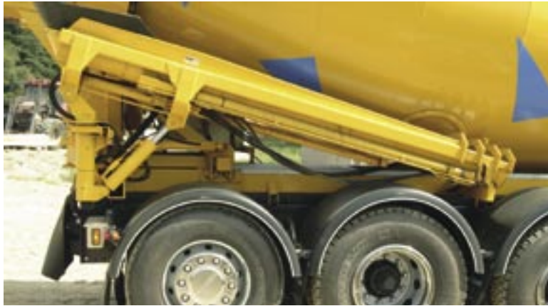
Rännan i transportläge.