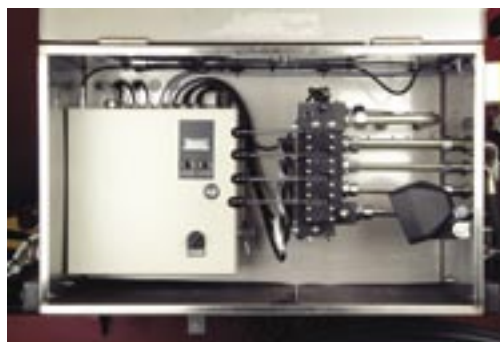
Styrskåpet med mottagare till radiostyrning.