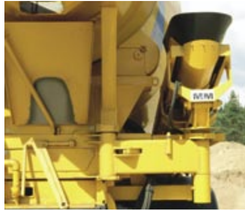
Låsarm och infästning av rännan.