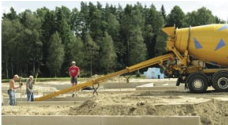
9 meters utskjut.