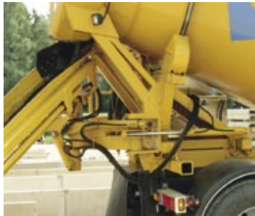
Här visas lyft, sväng- och transportfunktion.